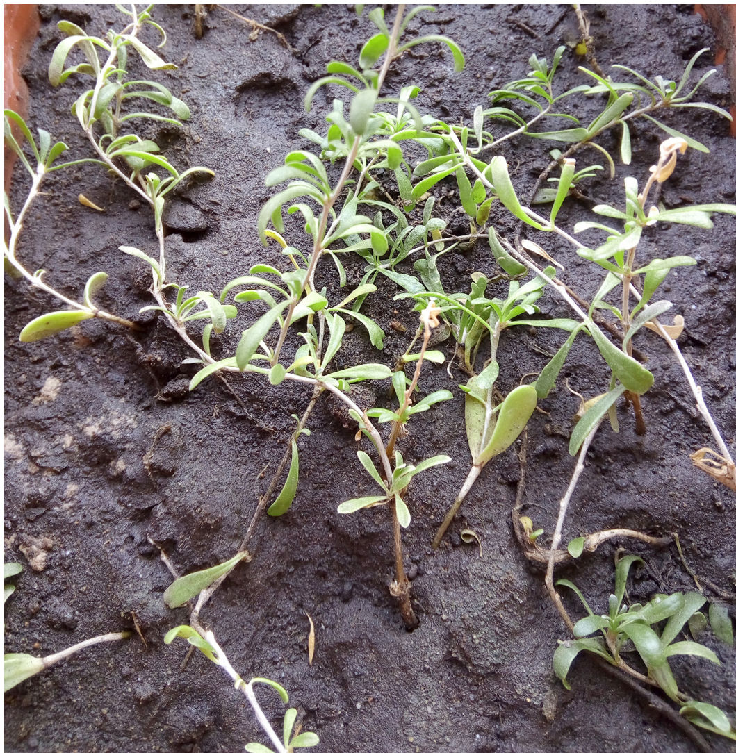
Рис. 1. Имматурное онтогенетическое состояние растений N. sibirica

еся кусты высотой не более 20—30 см, тогда как в равнинных степных районах Алтайского края они достигают высоты 60—80 см.