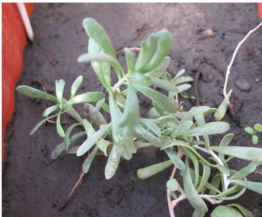
Рис. 4. Имматурное онтогенетическое состояние растений N. schoberi