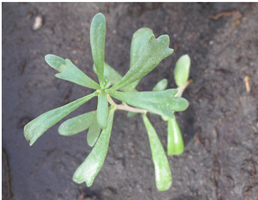
Рис. 3. Ювенильное растение N. schoberi

рые по этому параметру близки к растениям N. sibirica . Максимальная высота растений достигала 22,5 см (п. Лепсы, Казахстан). Для имматурных растений характерно частичное одревеснение нижней части первичного побега на высоту от 5 до 8 см (рис. 4). В средней части побега наблюдается расположение листьев в пучках или мутовках, на первичном побеге образуются побеги второго порядка.